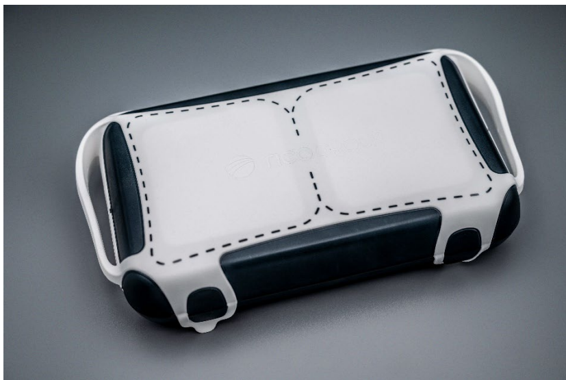
Figura 1 – " The Precious " pronto a usar após a injeção (ref: Rico)

Como em todos os eventos da Fakuma, há motivos de interesse para os visitantes que provocam longas filas de espera nos corredores. Um exemplo particular disto pode ser encontrado no stand da Arburg no pavilhão A3, onde é apresentada a versátil caixa multifuncional à prova de pó e de salpicos "The Precious". Foi desenvolvida e concretizada pela empresa especialista em elastómeros RICO. Uma peça grande de dois componentes injetada em PBT e um LSR autoadesivo foi simulado com a ajuda do SIGMASOFT®.